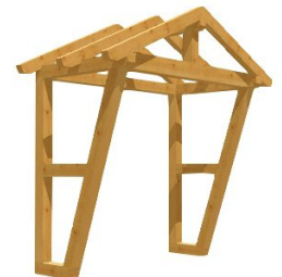
•&@é^ÁÚ^æ } , æ á