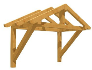
S[ ]-àæ á