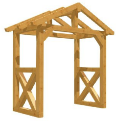
*^|æ^ÁÚ^æ } , æ á