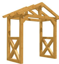
*^|æ^ÁÜ^æ^}, æ á